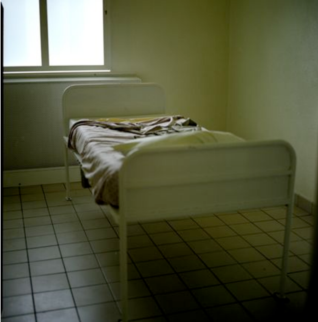
La chambre d'isolement